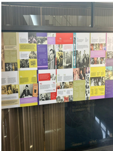
Figura 3 - Linha do Tempo Autoria: Maria Clara Ribeiro Data: 26/09/2024