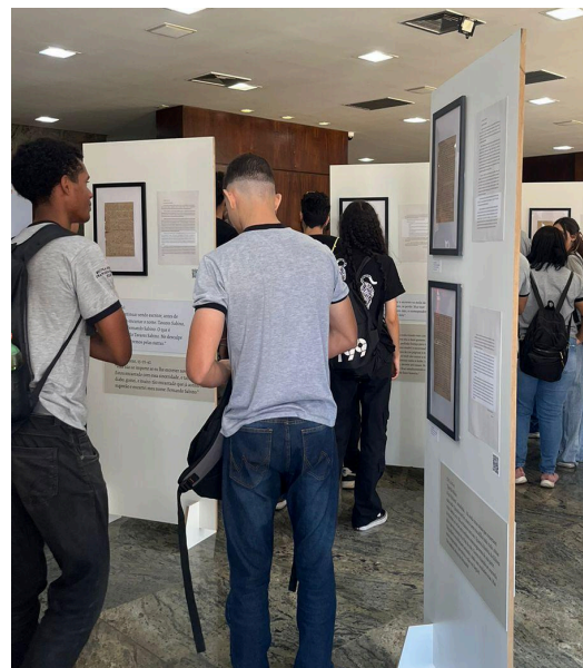
Figura 4 - Alunos da Escola Estadual Francisco Menezes Filho observando as cartas de Fernando Sabino e Mário de Andrade Data: 26/09/2024

A visita transcorreu de maneira satisfatória, com os alunos demonstrando grande interesse tanto nos documentos históricos quanto no conteúdo audiovisual. Ao final, foi constatado que o cronograma de atividades planejado para o projeto está sendo executado conforme o previsto, atendendo aos objetivos pedagógicos e culturais.