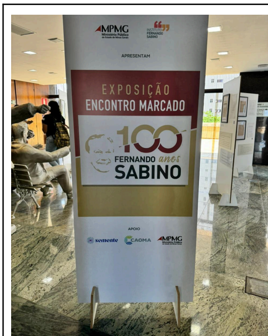
Figura 1 - Painel da exposição Data: 26/09/2024

político e cultural; Esculturas com Painéis informativos; exposição de estandartes com frases do Autor; Exibição de Vídeos e Curtas metragem. Nas imagens a seguir, é possível verificar a presença de cada elemento.