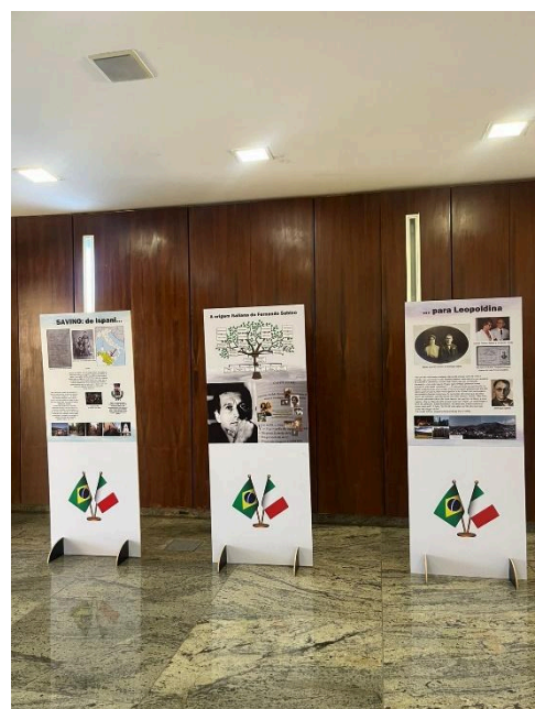
Figura 2 - Painéis com fatos biográficos e fotos Autoria: Maria Clara Ribeiro Data: 26/09/2024